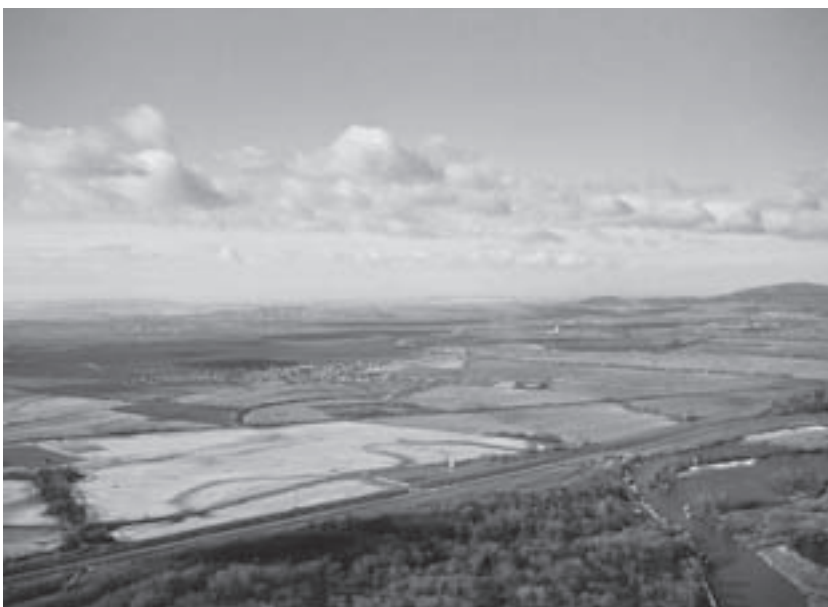
Obr. 2. Južná časť slovensko-rakúskeho prihraničného priestoru (urbanistická štúdia Urbanistické formulovanie priestorov IV. kvadrantu v súvislosti s protipovodňovou ochranou pre návrh ÚPN). Foto: V. Hrdý, 2004

V r. 2003 a 2004 boli vypracované dve urbanistické štúdie (UŠ) – Formovanie územného rozvoja pozdĺž západného biokoridoru Petržalky a štúdia Urbanistické formulovanie priestorov IV. kvadrantu v súvislosti s protipovodňovou ochranou pre Návrh územného plánu hl. mesta SR (ÚPN). Vychádzali z 3. variantu Konceptu riešenia ÚPN hl. mesta SR Bratislavy a z rozvíjania tiež obnovy ramenných systémov na pravom brehu Dunaja – územie Petržalky s pokračovaním cez Jarovce, Rusovce až do Čunova – definovaných už v UŠ Západná rozvojová os Petržalka – Juh (obr. 2 a 3). V súvislosti s novými požiadavkami na protipovodňovú ochranu Bratislavy bola overovaná možnosť trasovania „obtokového ramena“, splavného pre rekreačné plavidlá, vytváraného tak, aby bolo jednou z priestorovo-kompozičných osí v území a zároveň mohlo svojimi parametrami plniť funkciu obtoku pre „veľkú vodu“. Okrem rozvíjania tiež formovania budúceho územného rozvoja pravobrežnej časti Bratislavy na doposiaľ neurbanizovaných plochách bolo cieľom štúdií nájsť potenciálne miesto trasovania a ponechania územnej rezervy pre obtokové rameno do budúcnosti, v prípade ďalšie-