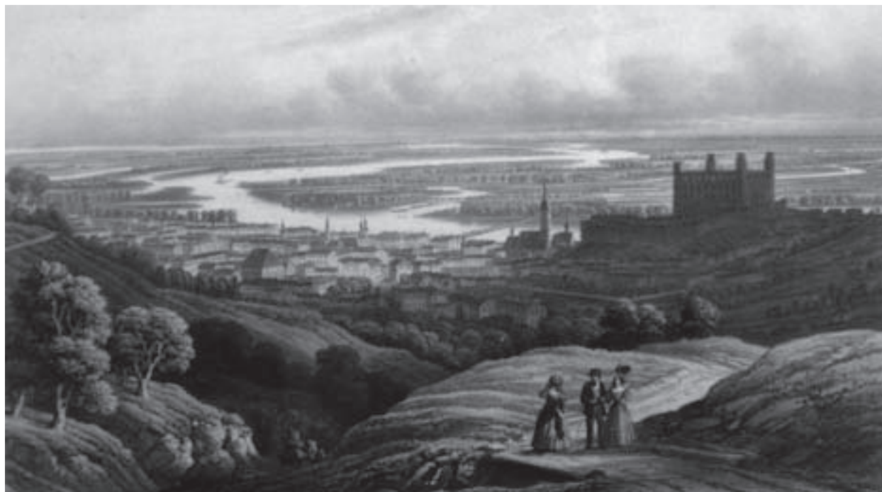
Obr. 1. Bratislava v polovici 19. storočia, dunajské ramená v pozadí (historická veduta). Foto: V. Hrdý, 2006

Magistrát hlavného mesta SR Bratislavy, Oddelenie koordinácie územných systémov, Primaciálne nám. 1, 814 99 Bratislava