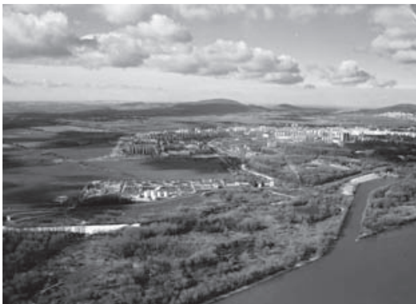
Obr. 1. Severná časť slovensko-rakúskeho prihraničného priestoru (urbanistická štúdia Urbanistické formulovanie priestorov IV. kvadrantu v súvislosti s protipovodňovou ochranou pre Návrh územného plánu hl. mesta SR Bratislavy).

Štátna hranica s Rakúskom vo vzdialenosti troch kilometrov od stredu mesta, Bratislavského hradu, v minulosti limitovala možnosť rozvoja mesta juhozápadným smerom. V hraničnom priestore s Rakúskou republikou nebolo možné plánovať rozvojové aktivity. Odstránením politických bariér, vstupom Slovenska do EÚ a otvorením Schengenského priestoru sa vytvorili celkom nové podmienky aj pre oblasť územného plánovania. Prihraničné rakúske obce prevažne vidieckeho charakteru pociťujú už v súčasnosti vplyv mesta Bratislavy na svoj rozvoj. Veď niektoré z nich, napr. Kittsee, Wolfsthal alebo Berg, sa nachádzajú bližšie k centru mesta Bratislavy ako niektoré jeho vlastné mestské časti a územne prirodzene inklinujú k jeho spádovému územiu.